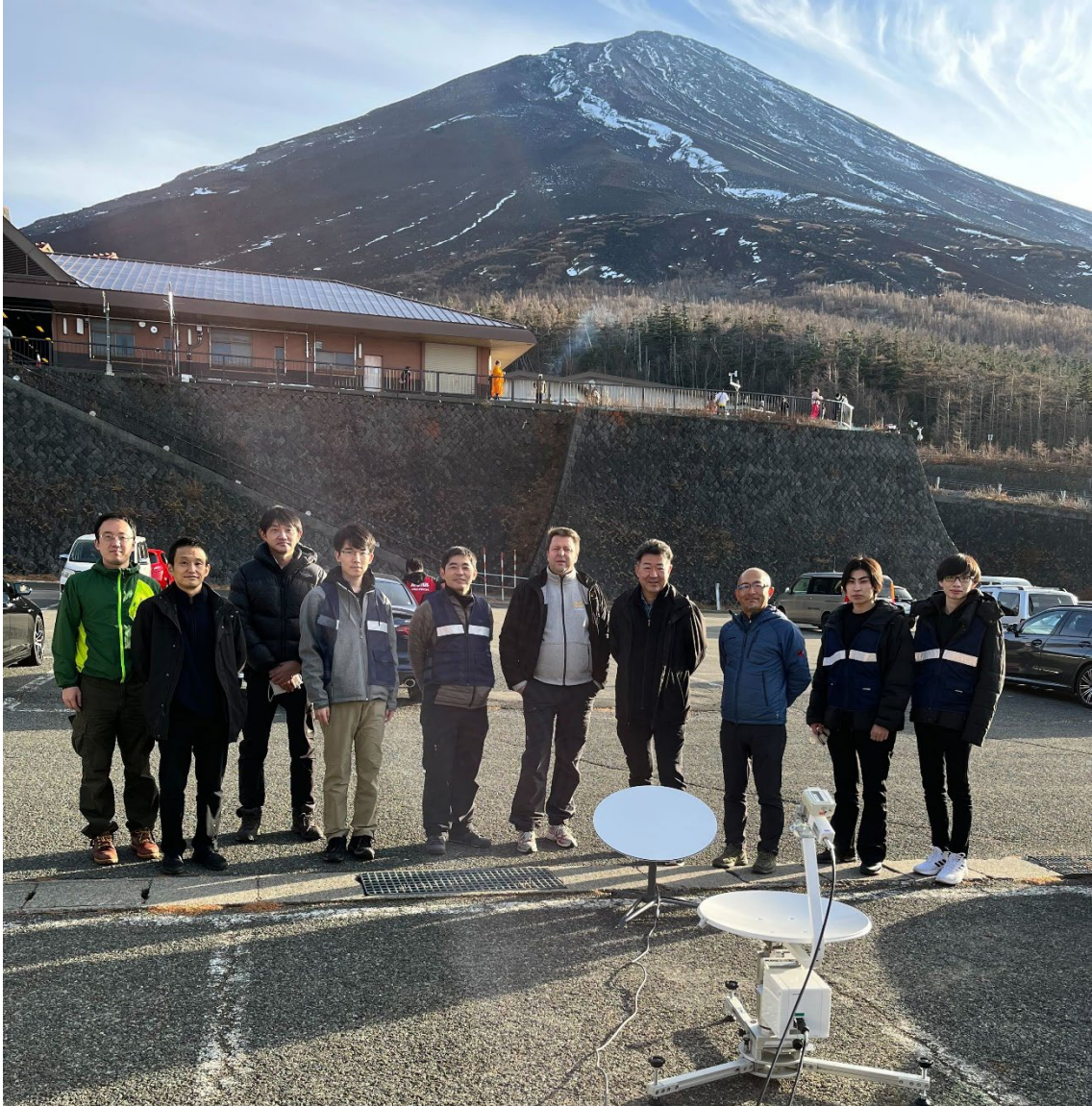
図3 東京大学と山梨県富士山科学研究所の実験メンバ、富士山5合目にて