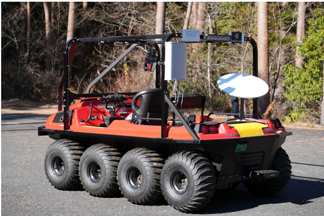
図2 8輪バギーへローカル5G、衛星インターネットアクセスサービスを搭載した有事の復旧、減災活動での情報通信網の運用コンセプトモデル